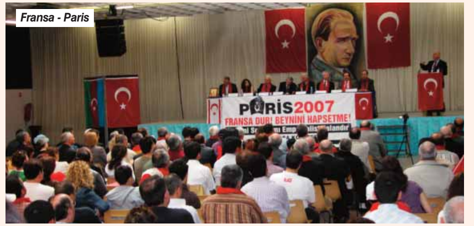
Fransa - Paris

Dönemin iktidar partisi Halk Hareketi Birliği (UMP) Milletvekili Valerie Boyer öncülüğünde yeni bir yasa tasarısı hazırlandı. (Boyer, bugün adı Cumhuriyetçiler olarak değiştirilen partinin senatörü olarak Marsilya'da Talat Paşa'nın katili Tehliryan'ın heykelinin açılışına katılıp konuşma yapan kişi). 5 Mayıs 2011'de, 577 milletvekilinin bulunduğu Meclis görüşmelerine 41 milletvekili katılmış ve 38 evet oyu ile tasarı kabul edilmiştir. Tasarı, 23 Ocak 2012'de Senato gündemine alındı ve yapılan oylamada, "Yasayla tanıyan soykırımların varlığını reddedenlere ceza" öngören ırkçı yasayı 86'ya karşı 127 oyla kabul edildi. Senatoda sadece 50 senatör bulunuyordu. Yasa 200'e yakın vekalet oyla kabul edildi. Meclis savaş mahkemesi oyunu sergileyen bir tiyatroya dönüşmüştü. Senaryoyu ABD yazmıştı. Rol paylaşımı da mükemmeldi: Savaş şefini Sarkozy, savcı rolünü Par-