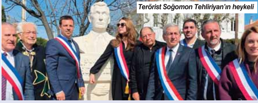
Terörist Soğomon Tehliryan'ın heykeli