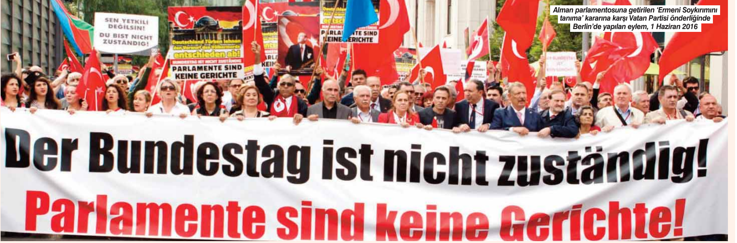
Alman parlamentosuna getirilen 'Ermeni Soykırımını tanıma' kararına karşı Vatan Partisi önderliğinde Berlin'de yapılan eylem, 1 Haziran 2016

2004 yılında İsviçre Türk Dernekleri Federasyonunun davetlisi olarak katıldığı bir konferansta soykırım olmadığını söyleyen Türk Tarih Kurumu Başkanı Prof. Yusuf Halaçoğlu hakkında İsviçre'de bir ceza soruşturulması açılmıştı. Bunun üzerine İşçi Partisi (Bugün Vatan Partisi) Genel Başkanı Doğu Perinçek İsviçre'ye giderek 7 Mayıs 2005 tarihinde Lozan Antlaşması'nın yapıldığı sarayın merdivenlerinde Almanca olarak "Ermeni soykırımı iddiası, tarihsel bir yalandır, uluslararası bir yalandır, emperyalist bir yalandır" şeklinde bir konuşma yaptı