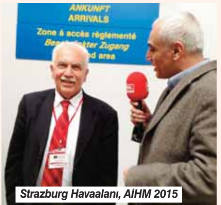
Strazburg Havaalanı, AIHM 2015

Paris Atatürkçü Düşünce Derneği Başkanı ve Avrupa Talat Paşa Komitesi üyesi olarak her evresinde bulunduğu 2005-2015 yılları arasında, 10 yıl boyunca verilen mücadeleler Ocak 2015'te AIHM'de zaferle sonuçlanmıştır.