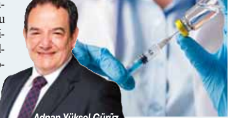
Adnan Yüksel Gürüz