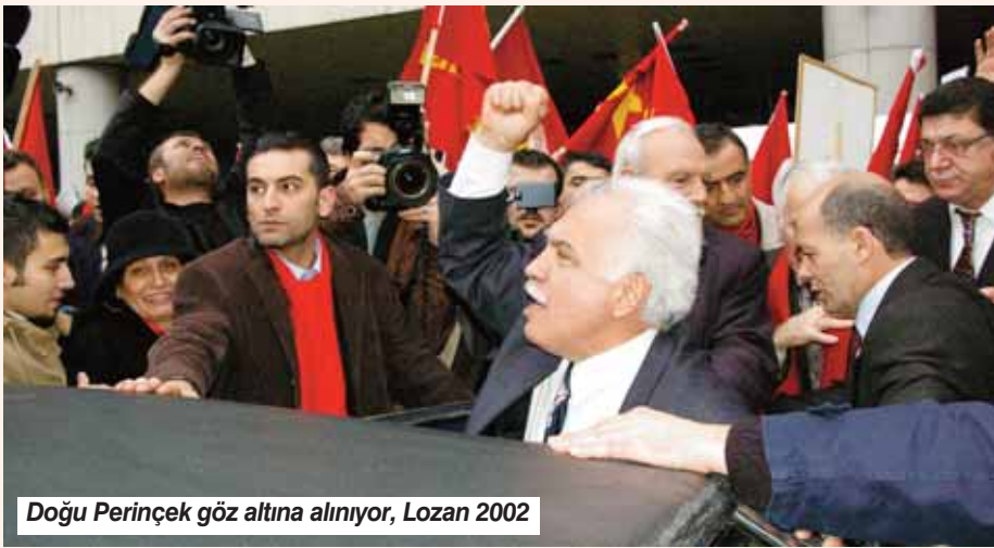
Doğu Perinçek göz altına alınıyor, Lozan 2002

2004 yılında İsviçre Türk Dernekleri Federasyonunun davetlisi olarak katıldığı bir konferansta soykırım olmadığını söyleyen Türk Tarih Kurumu Başkanı Prof. Yusuf Halaçoğlu hakkında İsviçre'de bir ceza soruşturulması açılmıştı. Bunun üzerine İşçi Partisi (Bugün Vatan Partisi) Genel Başkanı Doğu Perinçek İsviçre'ye giderek 7 Mayıs 2005 tarihinde Lozan Antlaşması'nın yapıldığı sarayın merdivenlerinde Almanca olarak "Ermeni soykırımı iddiası, tarihsel bir yalandır, uluslararası bir yalandır, emperyalist bir yalandır" şeklinde bir konuşma yaptı