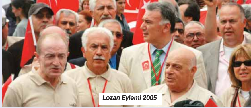
Lozan Eylemi 2005

Geçmişte Macron'a bu konularda mektup yolladım. O mektuplarda Ermeni Soykırımını tanıma kararının Avrupa İnsan Hakları Hukukuna ve Fransa hukukuna aykırı olduğunu anlattık. Bunları güncelleştirerek bir kez daha Fransa'ya bildireceğiz. Fransa'da ve Avrupa'da da bu konuda bir faaliyete geçiyoruz."