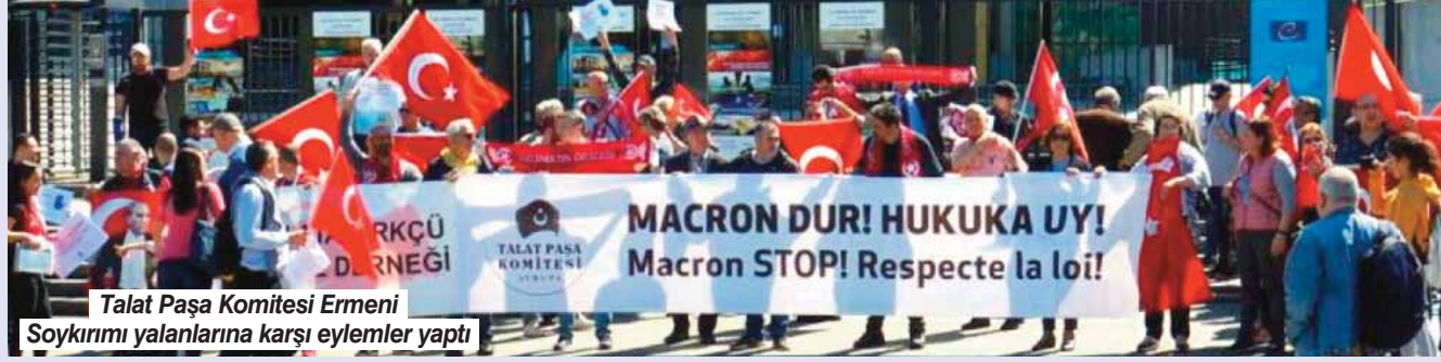
Talat Paşa Komitesi Ermeni Soykırımı yalanlarına karşı eylemler yaptı