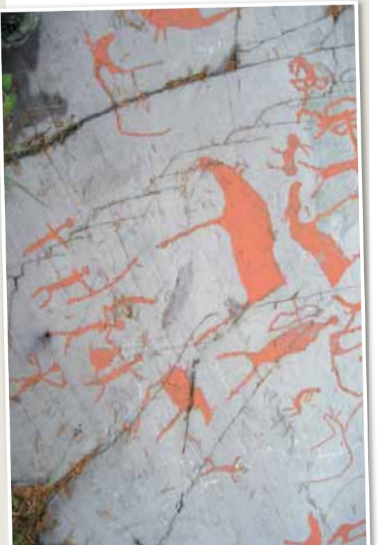
Belki bir av sahnesi belki de hayvan saldırısına karşı mücadele

Samelerin isyan nedeni, baraj gölünün Alta'dan 60 km. uzaktaki bir Same yerleşim bölgesi olan Måze şehrini, 1721'den kalma bir Same kilisesini ve Samelerin en büyük geçim kaynağı olan ren geyiklerinin otlaklarını da sular altında bırakacak şekilde planlanması. Göç yolları kesilen ren geyiklerinin baraj gölünü aşarak İsveç ve Finlandiya'daki otlaklara geçişi imkânsız olacağı için Sameler barajın yapılmasına şiddetle karşı çıkmışlar. Öte yandan baraj nedeniyle somon balığı bol bir nehir olan Alta nehrinin zengin hayvan ve bitki örtüsünün yok olacağı endişesi de baraj yapımına karşı çıkışın sebeplerinden olmuş. Samelerin bir kısmı Oslo'ya giderek parlamentonun önünde açlık grevine başlarken, diğerleri baraj bölgesindeki iş makinelerine kendilerini zincirlemişler. Polis hem Oslo'da hem de Alta'da şiddet kullanılarak Sameleri dağıtmış. 1981 yılında devlet terörü karşısında yenilgiyi kabul ettiklerini duyuran Sameler gösterileri durdurma kararı almışlar. Planlanan baraj inşaatı tamamlanarak 1987 yılında hizmete girmiş. Baraj inşaatının tamamlanmasından birkaç yıl sonra dönemin Başbakanı ve İşçi Partisi Başkanı Gro Harlem Brundtland'ın "Alta barajının yapılmaması gerekirdi" demesi ise siyasi bir itiraf.