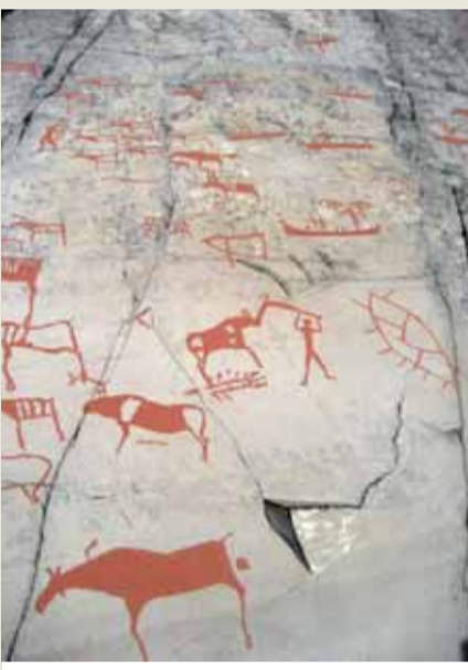
Kayıklarla geyikleri ve avcılarını bir toplu

resim, çizgi belgelenecek arşivlenmiş durumda. 2023 Şubat ayı itibarıyla arşivdeki dosya sayısı 22.000. Alta müzesi bir yandan geniş arşiviyle bilimsel çalışmalara ev sahipliği yaparken diğer yandan da bölgedeki yeni araştırmalara önenderlik ediyor. Alta arşivi kayıtları büyük ölçüde kamuya açık olmakla beraber erişimi kısıtlı dosyaların olduğunu da belirtelim.