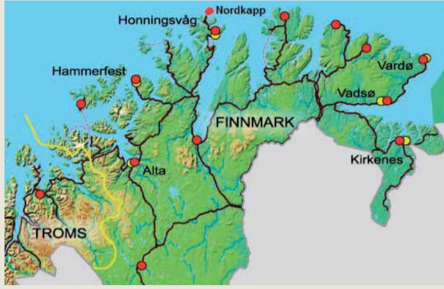
Finnmark bölgesi, Alta'nın olduğu fiyord, resimli kayaların da bulunduğu bölge