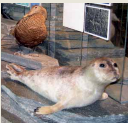
Müzedeki bir fok ve kaya resimlerinde fok olduğu tahmin edilen çizimin karşılaştırması