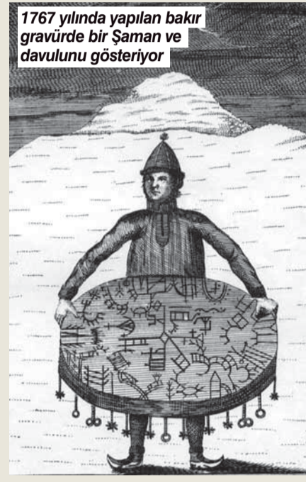
1767 yılında yapılan bakır gravürde bir Şaman ve davulunu gösteriyor