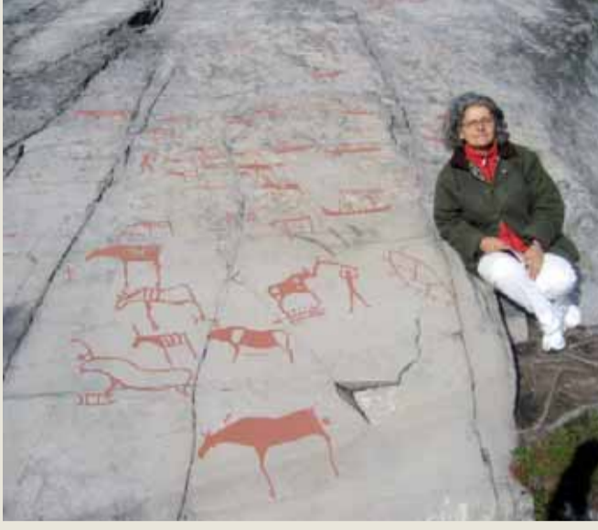
İlk göçerlerle son göçerlerin buluşması