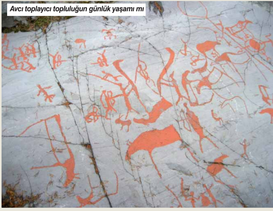
Avcı toplayıcı topluluğun günlük yaşamı mı