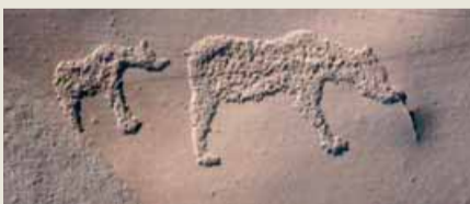
Renksiz kaya resimlerinde birinde ayı ve yavrusu

Kayalar yüksek rakımlarda bulunmuyor. Orman yosunları ve yemişleriyle kaplı çalıkların altındaki kayalar, genç kayalar olarak nitelendiriliyor. İlki tesadüfen 70 yıl önce bulunan ilk resimli kayanın ardından, Haziran 1973'te yine tesadüfen bulunan diğer resimli ve yazılı kayalar bir anda bilim insanlarının ve turistlerin ilgisinin bu bölgeye yönelmesine neden olmuş. Hemen koruma altına alınan kayaların bulunduğu yerlere onları tesadüfen bulanların isimleri verilmiş. Tabii bölgesine güzel bir jest, bölge halkının da kayalara ilgi duymasına, korumasına ve yeni resimli kayaları araştırmalarına yol açmış. Svein Erik Thomassen 1976 yılında Alta'ya yaklaşık 5 km. uzaklıktaki Hjemmeluft bölgesinde bir değil binlerce resimli kaya resmi ve işaret bulunan bir bölgeyi keşfetmiş. Hemen buraya bir açık hava müzesi kurularak 3.000 yazılı ve resimli kaya koruma altına alınmış. Ziyaretçilerin kayaların arasında rahatça ve resimlere zarar vermeden dolaşabilmesi için de 2,9 km. uzunluğunda bir asma köprülerle bezenmiş bir yürüyüş yolu yapılmış. Bilgiendirme panoları da ihmal edilmemiş. Bir ziyaretçi olarak yaz olmasına rağmen çok soğuk ve rüzgârlı bir havada 7000 yıl öncesinin avcı toplayıcı topluluklarının bıraktığı izler arasında dolaşmak sanki ilk göçerlerle buluşup tanışıyor gibi heyecan vericiydi. Ve bu izlerin