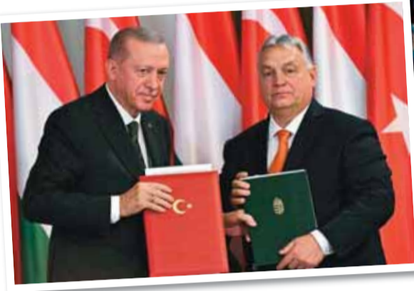
Orban Türk Devletleri Teşkilatı toplantısında

"Türkiye ile Macaristan, coğrafi yakınlıklarına ek olarak karşılıklı ilişkilerde güven ve saygıya sahip olan iki ülkedir. Türkiye'nin ve Macaristan'ın Batılı 'müttefikleri', iki ülkeye karşı da düşmanca bir tutum izlemekte ve iki ülkenin iç politikalarına da müdahil olmaya çalışmaktadırlar. Bu sebepler, bugünkü yakın ilişkilerin ve işbirliğinin gerekçelerini önmüze seriyor."