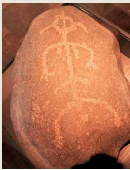
Pippistone-Pippi Uzunçorap taşı olarak bilinen ve 1950 yılında ilk bulunan taşın 4-5000 bin yıl önceden kaldığı sanılıyor

Günümüzden yaklaşık 7000 yıl önce yapıldığı anlaşılan resimli ve yazılı kayalar, insanların göç yollarını araştıran bilim insanlarının çalışmalarına da ışık tutmakta. Kayaların bir kısmı deniz seviyesindeyken diğerleri denizden 25-30 metre yükseklikte bulunmakta. Bu kayaların yer kabuğundaki değişimler nedeniyle yükseldiği belirtiliyor. Bilim insanları farklı seviyelerdeki kayaların farklı dönemlere ait olduğunu da ortaya çıkarmış. Şimdi kayaların üzerindeki resimlerin birbirleriyle ne kadar ilişkili olduklarını anlamaya çalışıyorlar. Kaya resimlerinde ren geyikleri, siğir geyikleri, ayı, kurt/köpek, tilki, tavşan, halibut (iri bir balık), balina, somon, kaz, kuğu gibi hayvanların resimleri yanı sıra geometrik desenler ve semboller, kayıklar, insanlar, hamile insan ve hayvan resimleri görülüyor. İnsanların ve hayvanların av, balıkçılık, dans ve ayin, toplantı gibi sahnelerde resimlenmesi, bu figürleri çizenlerin avcı ve toplayıcı denilen topluluklardan olduğuna işaret ediyor. Kåfjord'da bulunan yaklaşık 1500 resim, resim ve yazıların bazıları sert hava koşulları nedeniyle okunamayacak kadar yıpranmış. Şimdi daha iyi durumda olan kayaların koruma altına alınmasına ve belgelenebilmesine çalışılıyor. Yine Alta yakınlarındaki Langnesholmen ve denizden 203 metre yükseklikteki Komsa dağında da resimli kayalar bulunmuş.