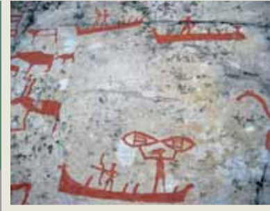
Ağ atan balıkçı mı anlatılıyor