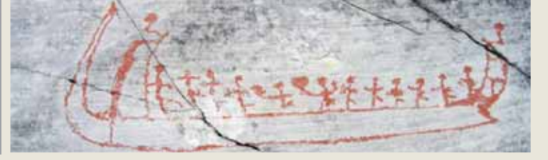
Kayıklarla balığa mı çıkılıyordu yoksa nasıl geldiklerini mi anlatıyorlar