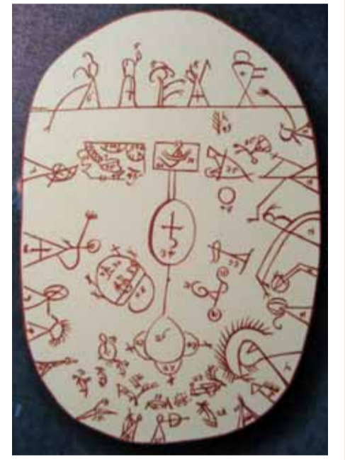
Samelerin günümüzde de kullandığı bir şaman davulu

3) Lars Levi Laestadius bir papaz. Kuzeyde Sameler arasında çalışırken kurduğu mezhep halen kuzey bölgelerinde mevcut. Kullandığı sert metotlar açısından farklı olan mezhep 1850 yıllarında Sameler arasındaki alkol bağımlılığını azaltmasıyla itibar kazanmış.